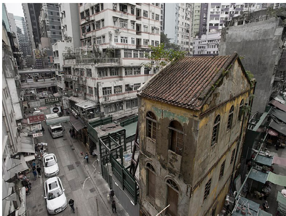
威靈頓街的永和號原瓦頂已遭市建局拆走（網上圖片）

易容的近義詞。就如陳炳釗鐵行里老家旁的中環中心在千禧年前橫空出世，一舉夷平此前一百年的社區結構。消失了的景物幻化成鬼魅，偶爾還會闖入人的想象。留下來的、活化後的軀殼，就如經過改造的孤魂，適應新時代。更新與活化，可以是一個漫長的過程，對象也不只是建築物，就連舊街坊的靈魂，或已被劃入重建範圍。